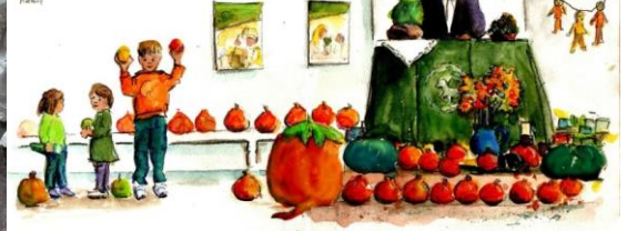
ERNTE-DANKFEST IN NEUDETENDORF 6.11.17