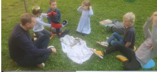
Kindergruppe Thema David