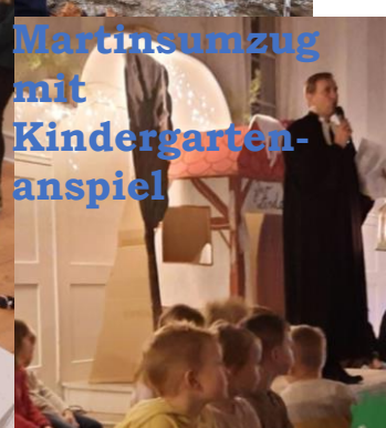
Martinsumzug mit Kindergarten- anspiel