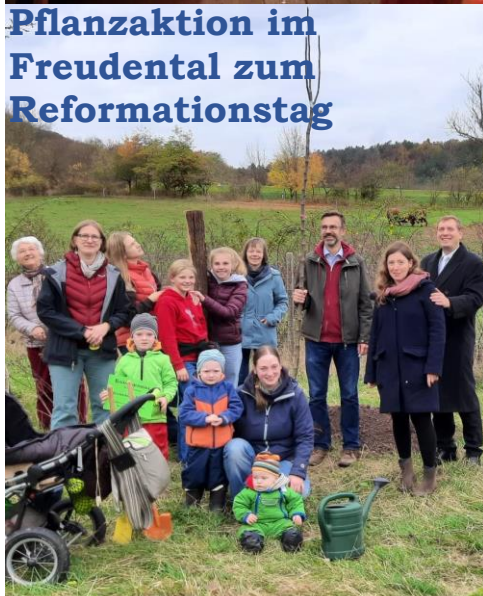
Pflanzaktion im Freudental zum Reformationstag