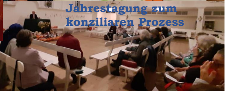
Jahrestagung zum konziliaren Prozess