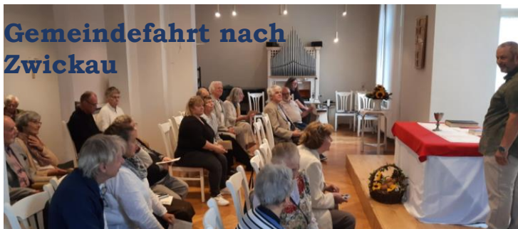
Gemeindefahrt nach Zwickau