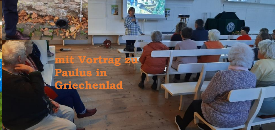
mit Vortrag zu Paulus in Griechenlad