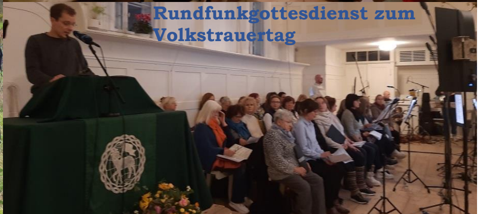
Rundfunkgottesdienst zum Volkstrauertag