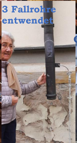
3 Fallrohre entwendet