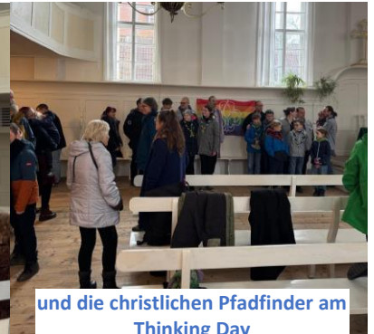
und die christlichen Pfadfinder am Thinking Day