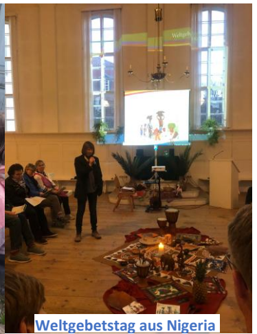
Weltgebetstag aus Nigeria