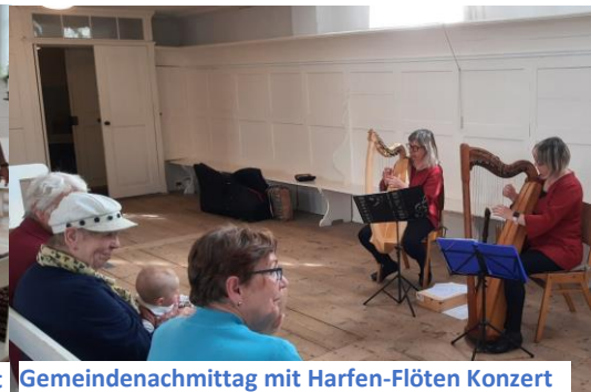
Gemeindenachmittag mit Harfen-Flöten Konzert