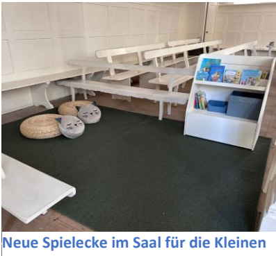
Neue Spielecke im Saal für die Kleinen