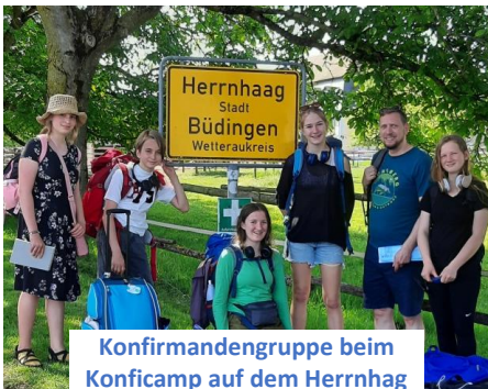
Konfirmandengruppe beim Konficamp auf dem Herrnhag