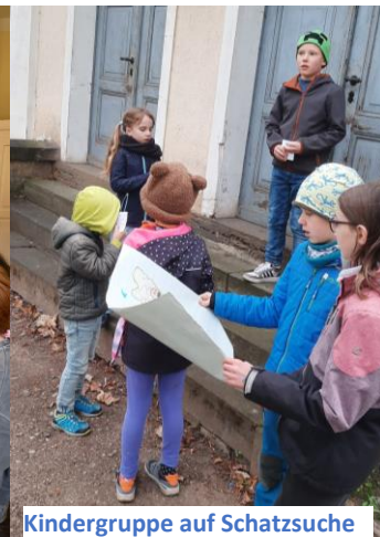
Kindergruppe auf Schatzsuche