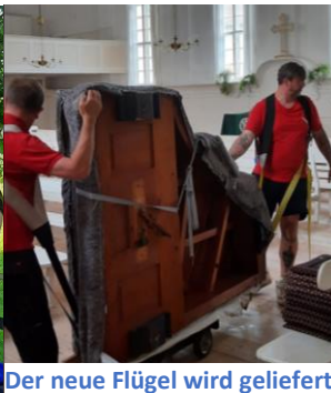
Der neue Flügel wird geliefert