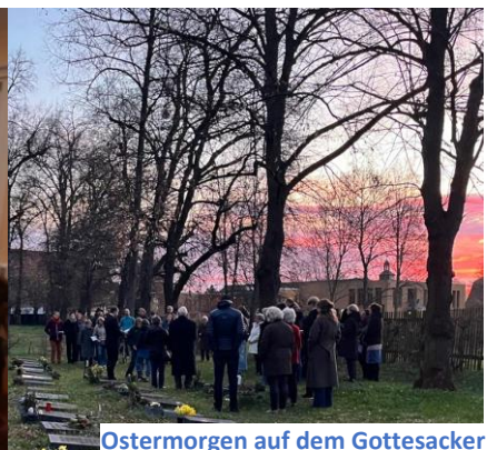
Ostermorgen auf dem Gottesacker