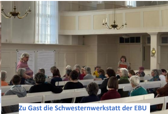
Zu Gast die Schwesternwerkstatt der EBU