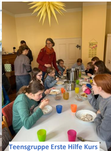
Teensgruppe Erste Hilfe Kurs